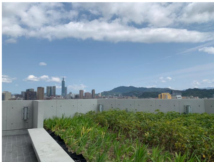
▲ R 樓（管制區域）植栽區