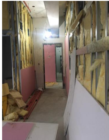
玻璃纖維棉隔音施作