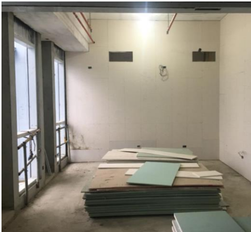
隔間雙面封板施作