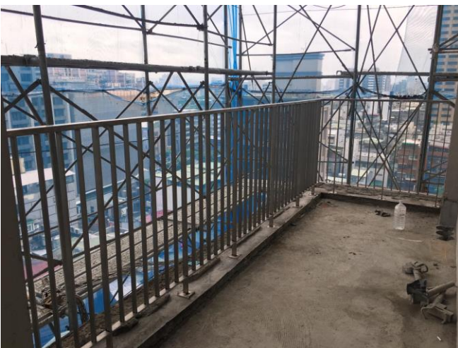
後陽台的欄杆施作