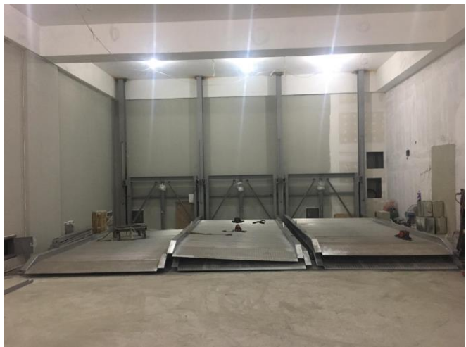
B2/B3 機械車位進料施作