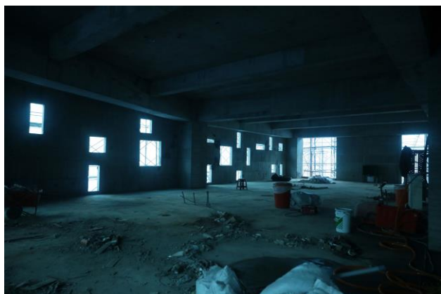
2/19 四樓內部大樓外觀點字版開窗位置